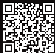
LUNCHKAART ALLERGENEN EN ENGELS

Geef deze aan ons door, we houden hier dan uiteraard rekening mee.